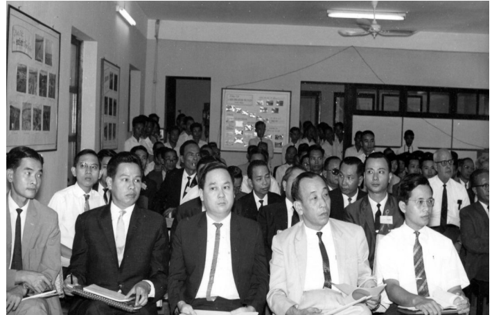
Từ trái sang phải: Ô. Ô. NXĐức Phụ Tá TGD CCh., PĐTăng TGD, BVLê ĐLVP, PHVĩnh TTK, BửuĐôn Phụ Tá Tổng Trưởng Công Chánh