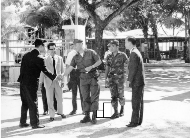
Ô TGD Công Chánh và Ô Trưởng Khu Nhatrang đón tiếp Ô Tổng Trưởng Công Chánh, Thiếu Tướng Tư Lệnh V2CT và Trung Tá Tỉnh Trưởng Nhatrang vào Hội Trường.