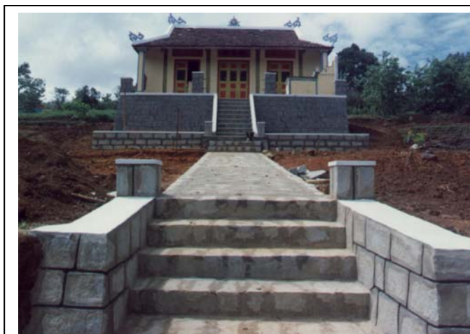
Nhà thờ Họ Nguyễn Thái hiến hữu

Ngoài ra để bảo vệ môi trường và phát triển thành phố, một số diện tích trồng rau trong khu nội thị sẽ được chuyển qua trồng hoa và ngành trồng rau, ngành kinh tế chủ lực của Thành phố, có thể phải di dời ra các vùng phụ cận. Các địa danh quen thuộc với ngành trồng rau như